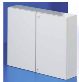
AE コンパクトボックス